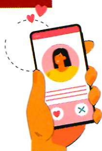
МОШЕННИЧЕСТВО ЧЕРЕЗ ЗВОНОК