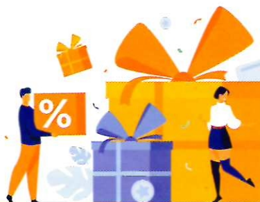
МОШЕННИЧЕСТВО ЧЕРЕЗ ЭЛЕКТРОННУЮ ПОЧТУ