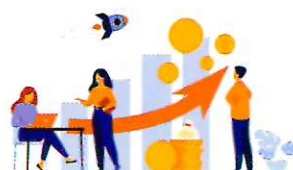
МОШЕННИЧЕСТВО НА ФИНАНСОВОМ РЫНКЕ