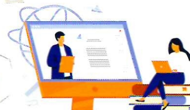
МОШЕННИЧЕСТВО ЧЕРЕЗ СОЦИАЛЬНЫЕ СЕТИ И МЕССЕНДЖЕРЫ

ИЛИ КАК НЕ НАСТУПАТЬ НА ОДНИ И ТЕ ЖЕ ГРАБЛИ