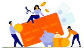
МОШЕННИЧЕСТВО С БАНКОВСКОЙ КАРТОЙ